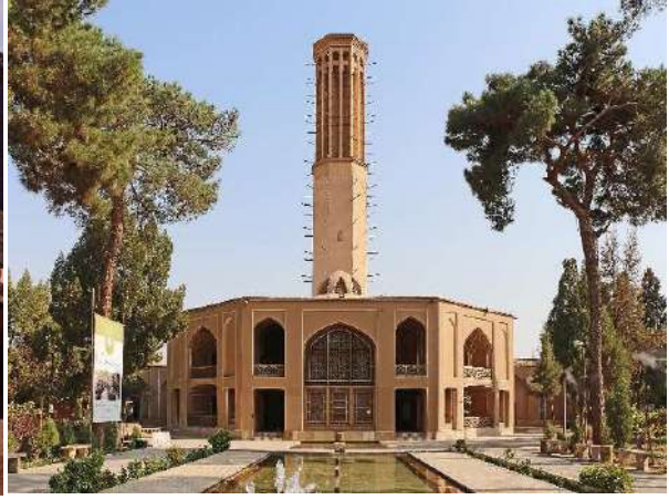
Devlet Abad Bağı