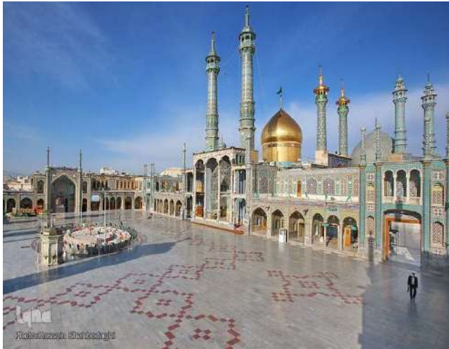
Hz. Masume Camii ve Türbesi