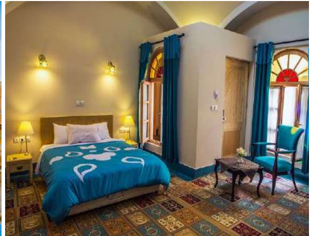
Dad Hotel Yezd (****)