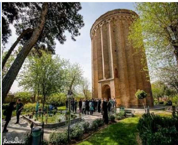
Tuğrul Bey Kulesi