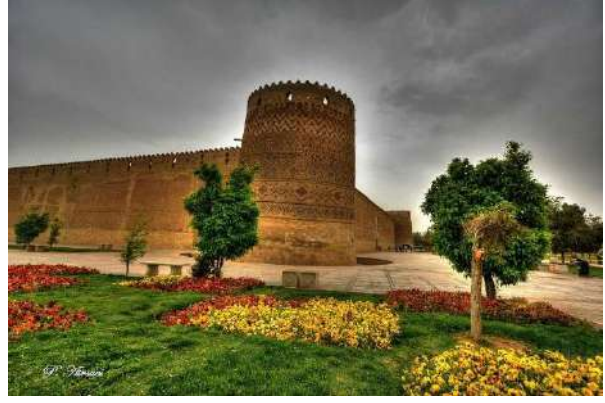
Karim Khan Kalesi