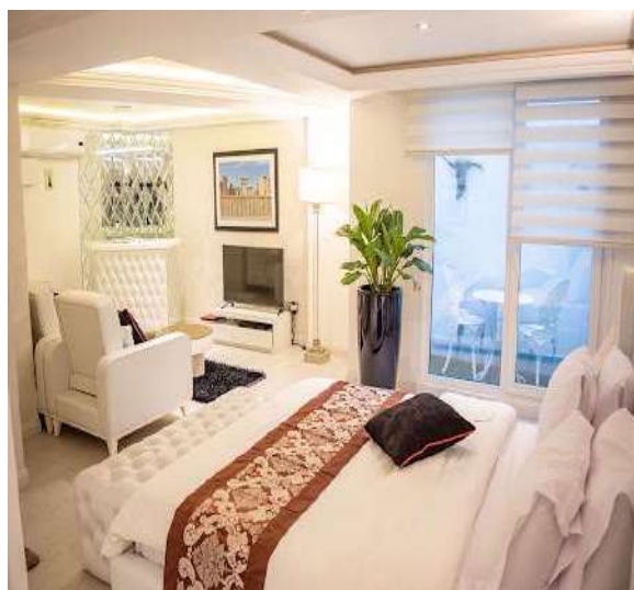
Taj Mahal Hotel Tahran (*****)