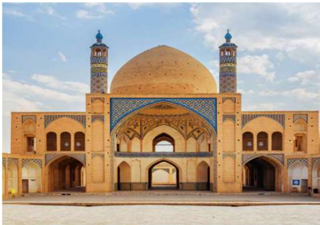
Bozorg Ağa Camii ve Medresesi