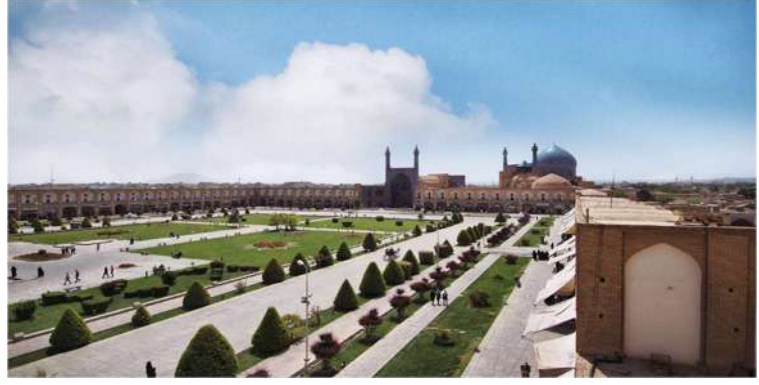
Nakş-ı Cihan Meydanı