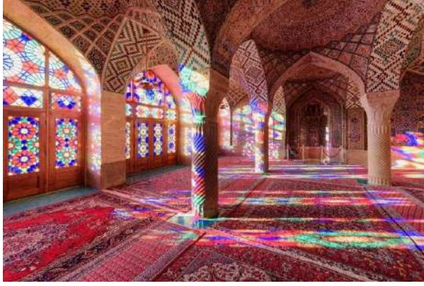
Nasr el-Mülk Camii