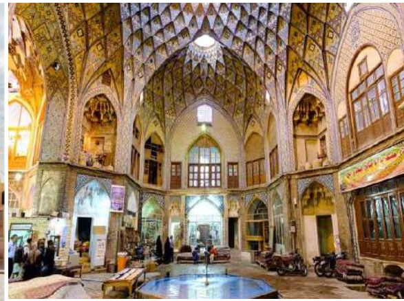
Kashan Kapalı Çarşısı