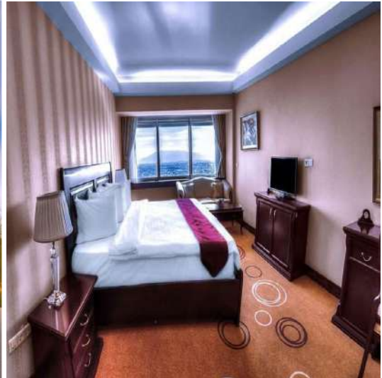
Shiraz Grand Hotel (*****)