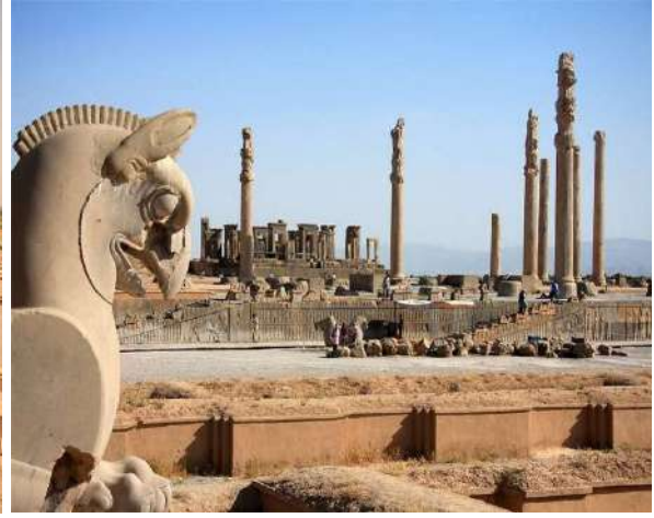
Persepolis Antik Kenti