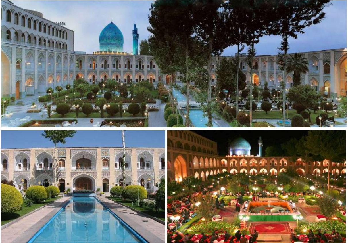
Abbasi Hotel Isfahan (*****)