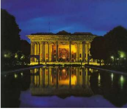
Çehel Kırk Sütun Sarayı