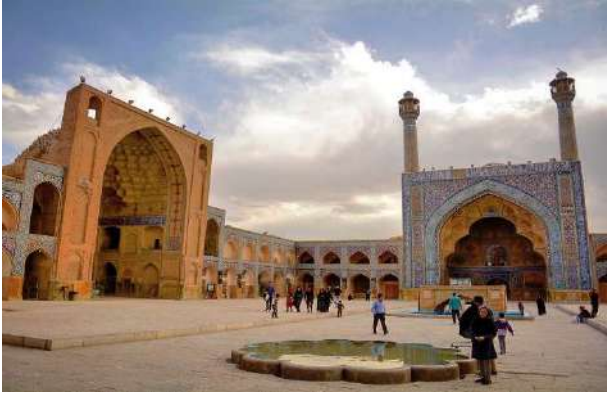
Masjed Jameh Camii